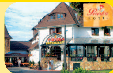
Hotel Piroksa***, Kossuth Lajos u. 60 , H-9737 Bük

Ungarische und internationale Küche, lactose- und glutenfreie Kost, Diät nach Absprache